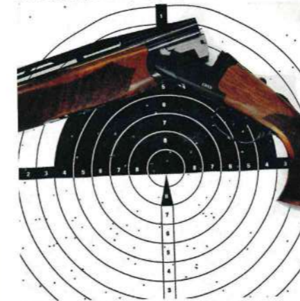
6. Non contenti, abbiamo deciso di sparare a 30 metri con lo strozzatore due stelle (stessa cartuccia); ancora un buon risultato per una distanza che si comincia a fare impegnativa