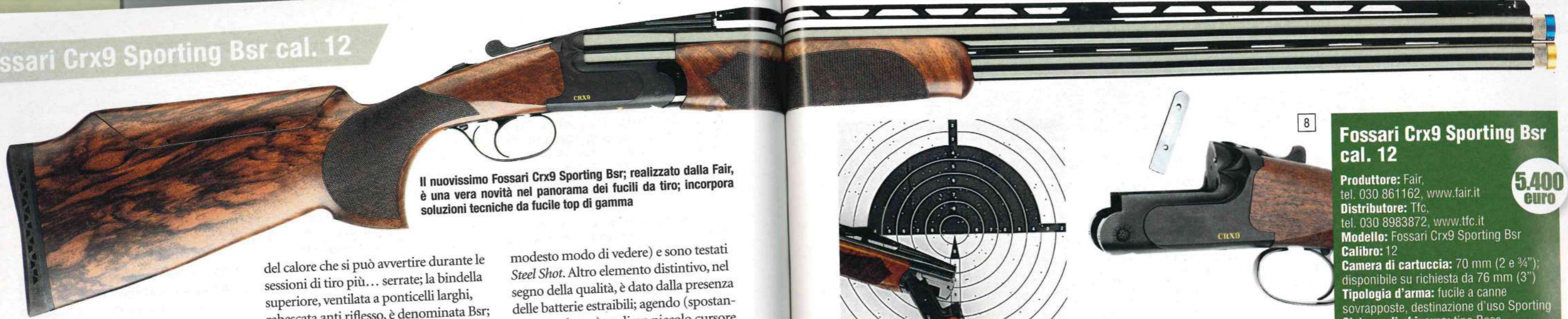
Il nuovissimo Fossari Crx9 Sporting Bsr; realizzato dalla Fair, è una vera novità nel panorama dei fucili da tiro; incorpora soluzioni tecniche da fucile top di gamma