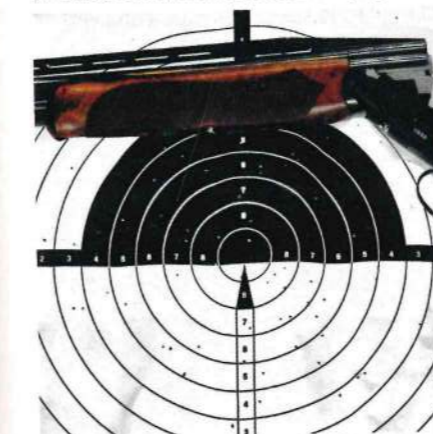
7. Infine, nelle stesse condizioni sperimentali, perché non testare il fucile a ben 35 metri con lo strozzatore una stella? L'abbiamo fatto e questi sono i risultati; siamo ampiamente soddisfatti