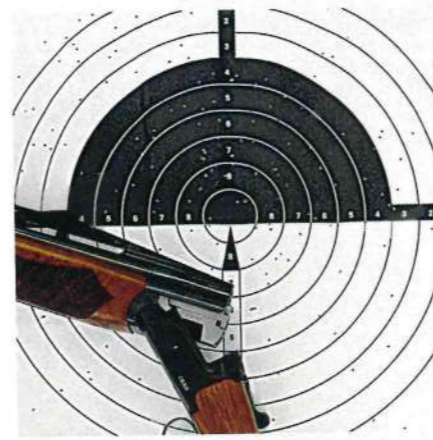
5. Prova di rosata, effettuata sparando a 25 metri con lo strozzatore tre stelle (cartuccia Rc2 da 28 grammi di piombo numero 7 e 1/2); pur se il Poi (Point of impact) è regolato verso l'alto del bersaglio, la distribuzione dei pallini appare molto buona; sensazione ottima allo sparo con assoluta mancanza di rinculo (con questa grammatura) dato il peso complessivo dell'arma (oltre 3,9 kg)