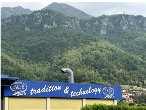
Blick über das F.A.I.R.-Werk auf die Berge, die das Val Trompia einrahmen.

Die kleine norditalienischen Gemeinde Marcheno, traumhaft schön in der Provinz Brescia in der Lombardei, genauer gesagt im Val Trompia, gelegen, wird auch das Ferlach Italiens genannt. Reihen sich hier nämlich viele italienische Waffenhersteller mit Weltruf, wie Beretta, Perazzi, Caesar Guerini und auch F.A.I.R. aneinander.