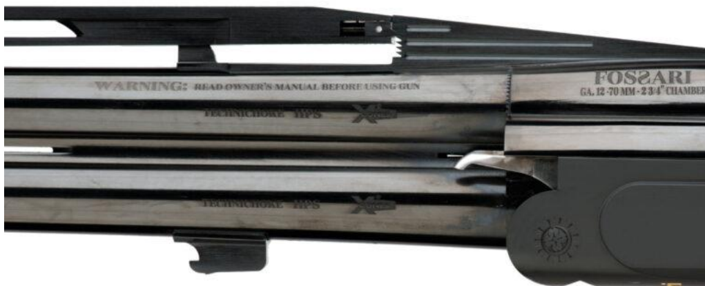
Läufe mit X-

Das System ist vollständig aus einem einzigen Stück Stahl gefertigt und wird auf einer 5-Achsen-CNC-Fräse bearbeitet. Die Boss-Verriegelung verfügt über einen übergroßen Verriegelungsbolzen, der auf der Mittellinie des Laufs platziert ist und eine dauerhafte Verriegelung garantiert. Für mehr Festigkeit und Zuverlässigkeit sind alle wesentlichen Komponenten der Flinte aus geschmiedeten Blöcken gefertigt.