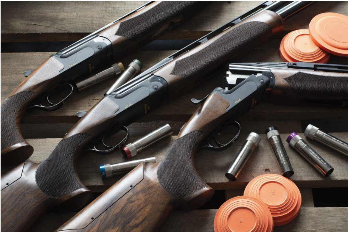
Flinten der CRX9-Reihe von Fossari

Die kleine norditalienischen Gemeinde Marcheno, traumhaft schön in der Provinz Brescia in der Lombardei, genauer gesagt im Val Trompia, gelegen, wird auch das Ferlach Italiens genannt. Reihen sich hier nämlich viele italienische Waffenhersteller mit Weltruf, wie Beretta, Perazzi, Caesar Guerini und auch F.A.I.R. aneinander.